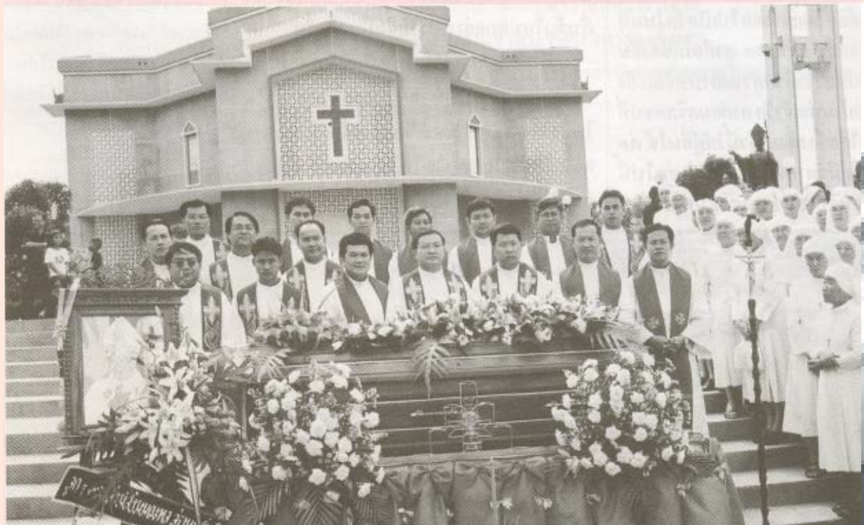
วันที่ 25 พฤษภาคม 2003 ณ วัดแม่พระฟาติมา (หัวขุยยาง) ประจวบคีรีขันธ์