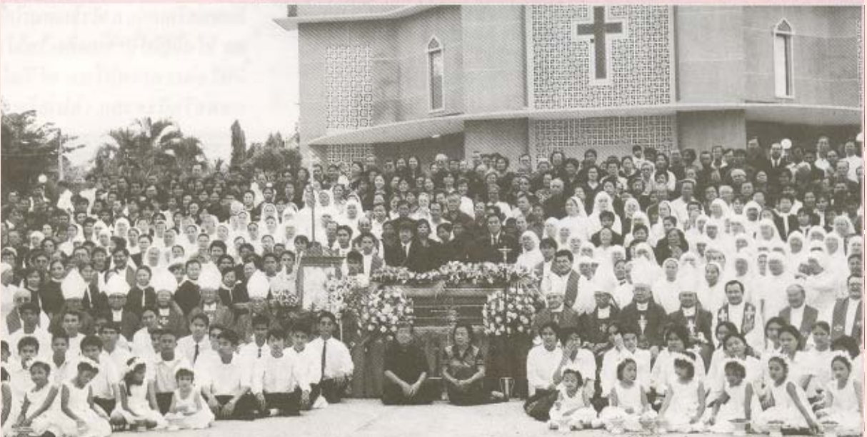
พระคาร์ดินัลไมเกิ้ล มีชัย กิจบุญชู เป็นประธานในมิสซาปลงศพ