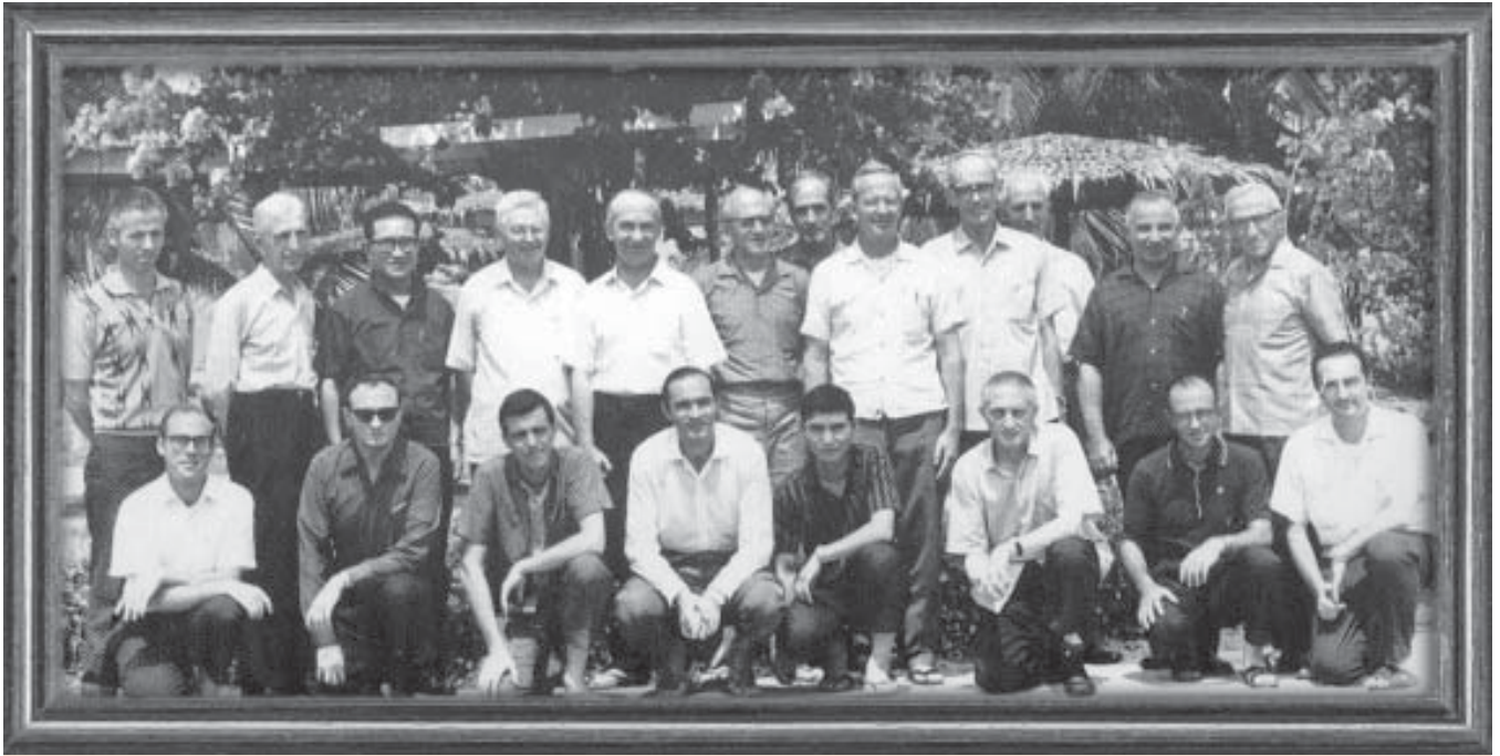
พระสงฆ์คณะเยสุอิตรุ่นแรกที่เข้ามาทำงานในประเทศไทย (สมัยที่สอง) ค.ศ.1954 (ถ้าทราบชื่อว่าใครเป็นใคร โปรดส่งข้อมูลให้ “เพื่อนสงฆ์” ทราบด้วย จะขอบคุณมากครับ)