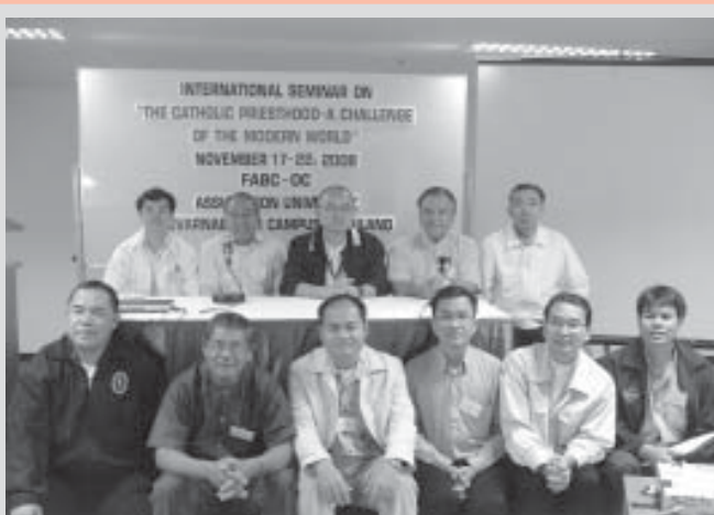
ประชุม FABC-OC ที่มหาวิทยาลัยอัสสัมชัญ บางนา “The Catholic Priesthood- A Challenge of the Modern World” วันที่ 17-23 พฤศจิกายน ค.ศ.2008