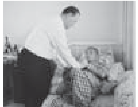
พระคุณเจ้ายอด พิมพิงสาช เยี่ยมคุณพ่อปกมล เสริมอภินิหาร เมื่อวันที่ 6 พฤษภาคม 2004