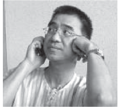
คุณพ่อเตตรา ฮามรณชีตนี้ ภาพนี้ถ่ายขณะป่วยอยู่ที่ ร.พ.เซนต์หลุยส์ ขอให้หายไวๆ นะครับ.....