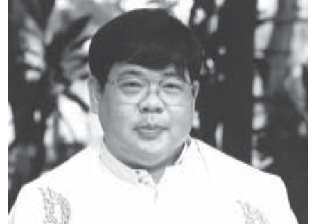
คุณพ่อพิชิต (พ่อมต) ตำรวจศักดิ์ ตอนนี้ต้องใส่ไม้เท้าช่วย ขอให้แข็งแรง.....